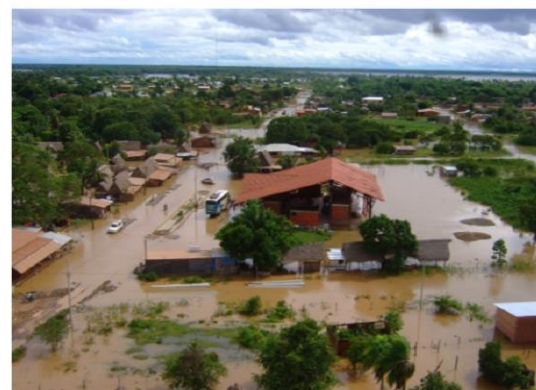
Foto: Terminal de Santa Rosa inundada-Beni-Bolivia, Febrero 2014

Difusión de información sobre el Programa GeoSUR, la Red Geoespacial de América Latina y el Caribe y el Programa sobre mapeo de las inundaciones en tiempo real en esta región por la Universidad de Colorado. GeoSUR cuenta con la coordinación de CAF - Banco de desarrollo de América Latina y