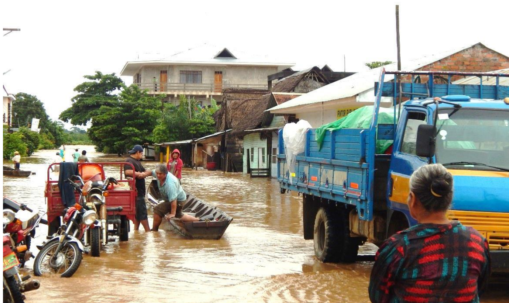
Foto: Inundación de febrero 2014 en Rurrenabaque-Departamento del Beni-Bolivia